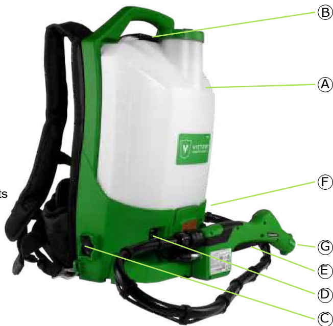
Schéma des Principaux Composants