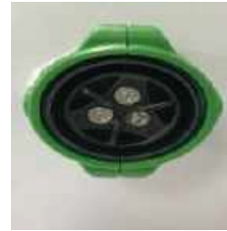
Buse № 2 (Propre)