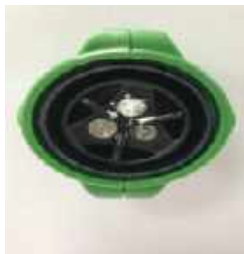
Buse № 1 (Sale)

Pour réduire le risque de blocage, nous recommandons qu'après tous les deux ou trois jours d'utilisation, de pulvériser un réservoir d'eau dans l'unité pour éliminer toute accumulation de produit chimique résiduel qui pourrait s'être produite.